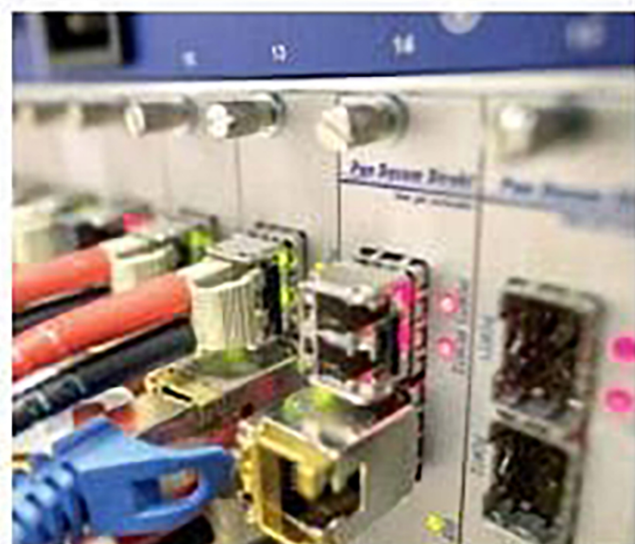
• Fibra ottica, lunedì si parte da Maia Alta

Città divisa in tre macro-aree. La spesa del primo lotto supera i 5 milioni di euro