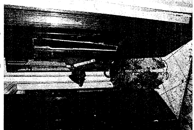
L'appartamento occupato dai viados in cui è avvenuta l'aggressione

Viados, è qui la festa. Bottigliate ai carabinieri