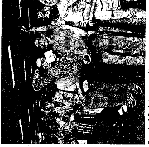
Fans degli Oasis in attesa a Linate

Oggi gli Oasis saranno ospiti alle ore Dee-Jay e alle 16 a Radio Rete 105. Un verblitz a Milano, il loro: ripartiranno in seradri, dove continueranno la promozione che uscirà a fine agosto (intitolato «Be che è stato preceduto dalla pubblicazione «D'you know hat I mean», già arrivato in classiche di vendita.